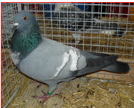
Szpak niebieski z białymi pasami

Gołębie szpaki, należące do grupy V – barwne, znane już były w XVI wieku w Schwarzwaldzie, na południu Niemiec. Stąd rozprzestrzeniły się na całe południowe Niemcy, a następnie na wszystkie regiony nad Renem i Łabą. Obecnie hodowane są w całej Europie. W południowych Niemczech hodowano głównie szpaki czarne. W Turynii, gdzie powstało wiele ras gołębi, szczególnie kolorowych, wyhodowano szpaki niebieskie. Mieszkańcy Turynii pytali: Kto powiedział, że szpaki muszą być tylko czarne? Odpowiedzią jest wyhodowanie szpaka ciemnogłowego niebieskiego.