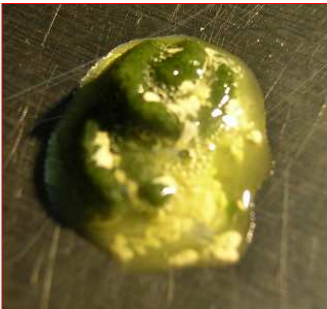
Fot. 1: kałomocz chorego gołębia

Gołębie zakażają się najczęściej drogą pokarmową, rzadziej erogenną. Zakażona