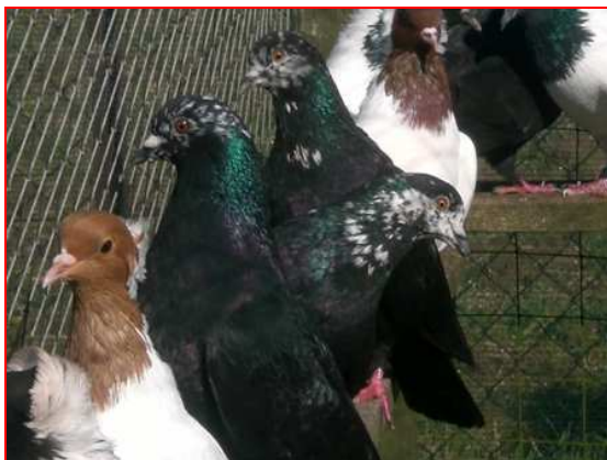
Południowoniemieckie pstrogłowe i południowoniemieckie murzyny

Chociaż rasa jest bardzo stara, jednak do rejestru gołębi barwnych trafiła dopiero po ostatniej wojnie. Czyżby o niej zapomniano? A może dlatego, że ekstrawaganckie gołębie z tygrysimi głowami było widać na prawie każdym szwabskim dachu i dlatego traktowano je jako lokalną wersję polnych gołębi, którymi ze względu na pierwotną budowę i mało atrakcyjny rysunek nie było warto się interesować? Podobno jeszcze dziś można w okolicznych wsiach natrafić na stada, któ-