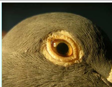
Fot. 3: odbarwienie tęczówki