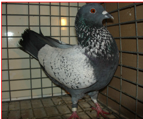
Szapka niebieski srebrny

Podgardle powinno być dobrze wykrojone, szczególnie u ciemnogłowych. Szyja