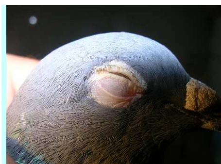
Fot. 2: Światłowstręt – pierwszy objaw postaci ocznej

Klasycznie wyróżnia się postać pokarmową charakteryzującą się biegunką, stawową, w której obserwuje się zapalenie stawu łokciowego lub stępy. Przypominająca paramyksowirozę postać nerwowa występuje najczęściej u gołębi młodych. Można jeszcze wyróżnić "postać oczną" objawiającą się silnym światłowstrętem. Przy tej postaci choroby szybko dochodzi do zmiany zabarwienia tęczówki (jaśnieje) i w krótkim czasie dochodzi do ślepoty. Pierwszym symptomem, który powinien nasunąć podejrzenie salmonellozy jest wysoka śmiertelność młodych gołębi w gnieździe, której nie poprzedzają prawie żadne objawy kliniczne.