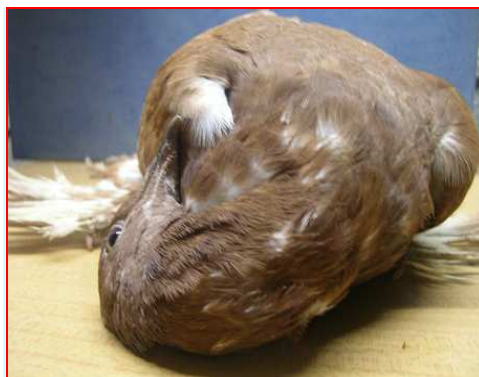
Fot. 7: paramyksowiroza

Leczenie powinno być wszechstronne i obejmować następujące czynności: - antybiotykoterapia według antybiotykoogramu, -zwalczanie bakterii w środowisku poprzez intensywną dezynfekcję, -budowanie odporności poprzez szczepienia ochronne, -wykluczanie konkurencyjne poprzez stosowanie probiotyków, -utrudnianie kolonizacji poprzez stosowanie zakwaszaczy, -eliminację nosicieli.