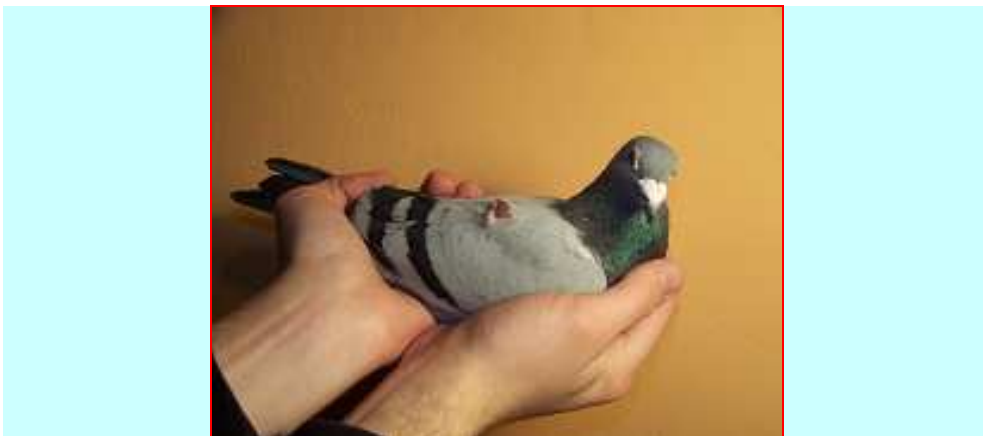
Fot. 6: klinicznie identyczne zapalenie stawu wywołane przez gronkowce