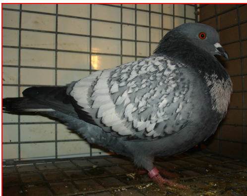
Szpak niebieski białołuskowaty

Poszczególne odmiany nieco różnią się w budowie od siebie. Najstarsza odmiana szpaka ciemnogłowego jest dosyć przysadzista o nieco wysuniętej piersi. Szpaki