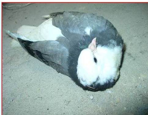
Fot. 5: postać nerwowa