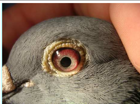
Fot. 4: oko zdrowe (tego samego gołębia).

Jedyną metodą pewnego potwierdzenia choroby jest badanie bakteriologiczne, pozwalające na wyhodowanie pałeczek salmonelli i wykonanie antybiotykoogramu, który pomoże dobrać najbardziej skuteczny lek w walce z chorobą.